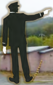
幾寅駅『鉄道員』幌舞駅