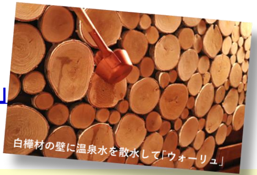
白樺材の壁に温泉水を散水して「ウォーリュ」