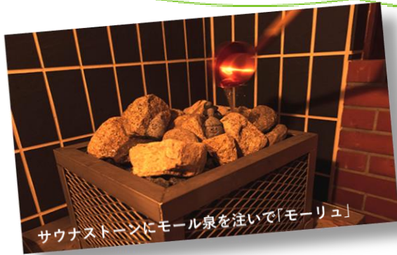
サウナストーンにモール泉を注いで「モーリュ」

十勝初！本場フィンランド式「ロウリュ」や 壁に施した十勝「白樺」の香りがより深いリラックスへと導きます！ 40カ国以上のサウナを体験したプロサウナーお墨付き