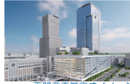
再開発事業完成イメージ

◆北海道新幹線札幌開業、札幌駅周辺の開発を見据え、道都札幌の玄関口にふさわしい空間形成と、高次都市機能・交通結節機能の強化を目指します。