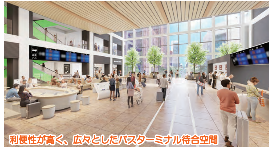
利便性が高く、広々としたバスターミナル待合空間