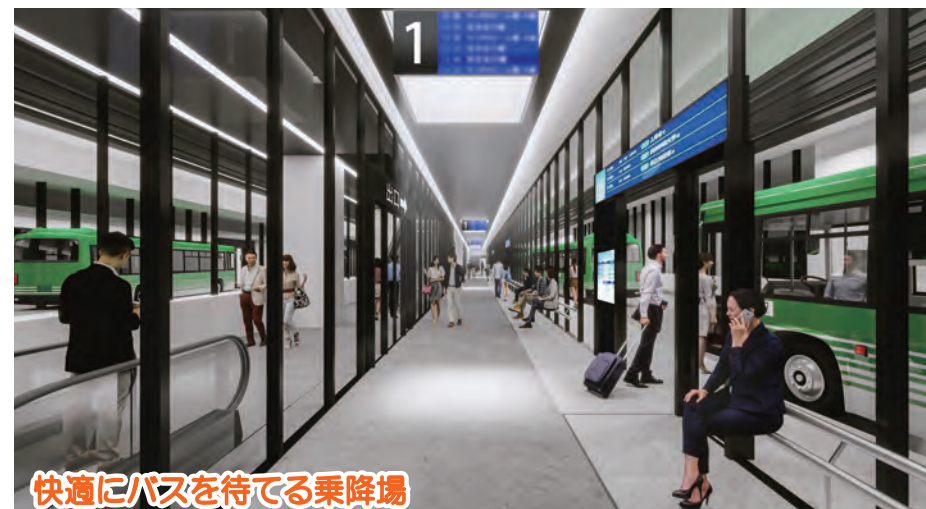
快適にバスを待てる乗降場

※建物外観や形状、内部レイアウト等はイメージであり、実態と異なる場合があります。