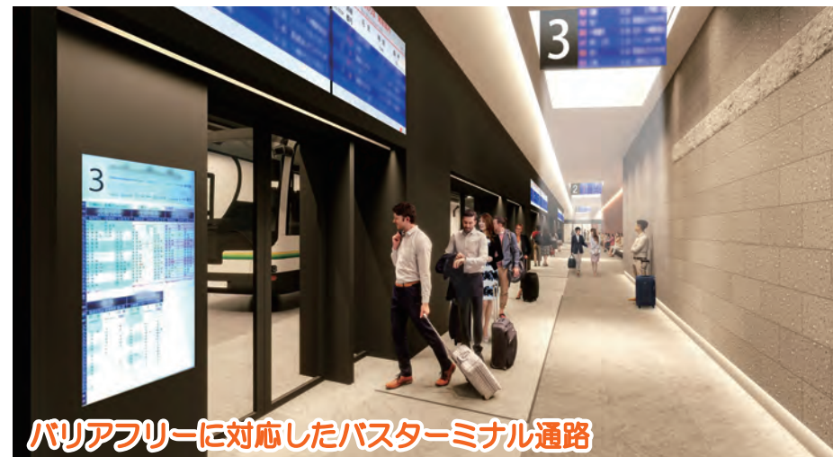
バリアフリーに対応したバスターミナル通路