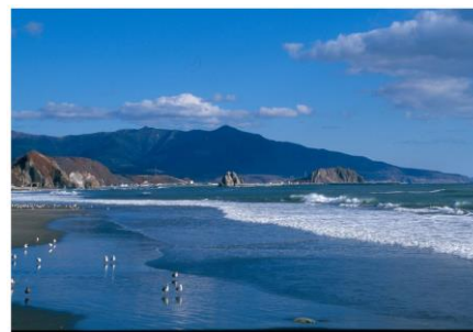
鵜苫(様似町)の海岸